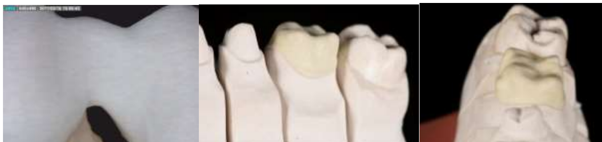
Figura Nro 3. Orientación de las fibras coherente con el eje de fuerzas oclusales

En el siguiente cuadro se resumen las propiedades de los polímeros mencionados: