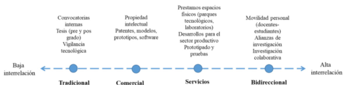
Figura 2. Mecanismos de enlace entre universidad y empresas

Por otra parte, los mecanismos de transferencia buscan la apropiación de resultados, aportando la claridad de derechos de propiedad del conocimiento y las políticas de aseguramiento sobre nuevas tecnologías. De acuerdo con Morales Rubiano, Sanabria Rangel y Plata Pacheco (2016), los mecanismos de transferencia pueden ser definidos como articuladores para la generación de conocimiento en la relación U-E. En este sentido, Dutrénit y Arza (2010), a partir del estudio de casos en Latinoamérica, evidencian dinámicas de interacción que generan estos mecanismos: tradicional, servicios, comercial y bidireccional (Figura 2).