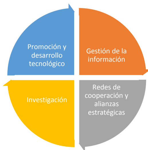
Ilustración 3. Ejes temáticos del observatorio.

Para el observatorio de tendencias en líneas de investigación contable, se determinarán las principales actividades comprendidas en diversos ejes estructurales, los cuales pretenden asociar de manera práctica las diversas acciones que permitirán el desarrollo sostenible del observatorio.