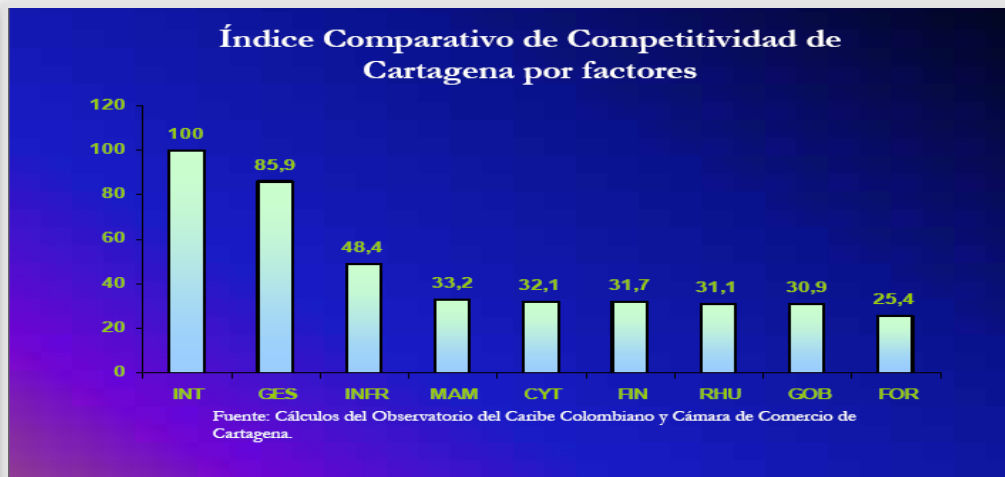
Gráfica 1. Índice Comparativo de Competitividad de la ciudad de Cartagena.